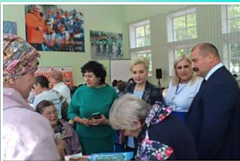
Региональный фестиваль социальных практик «ВРЕМЯ ЖИТЬ»