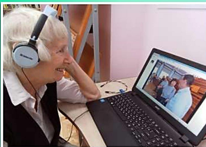
Социальный проект «МОИ СОЦИАЛЬНЫЕ СВЯЗИ»