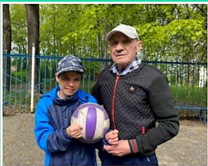
Социальный проект «#внукиДЕДА»