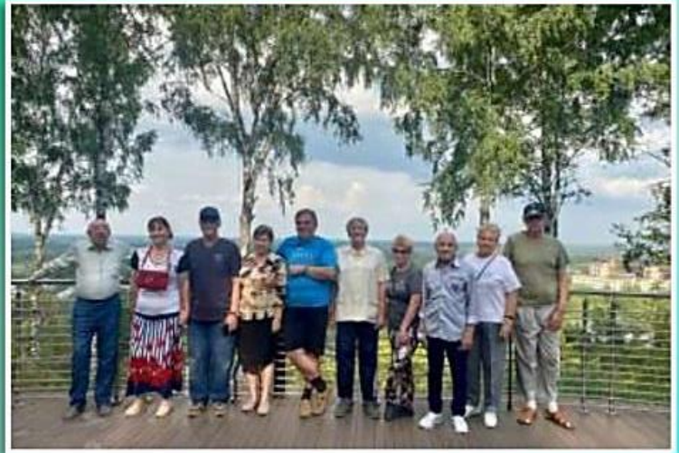
Социальный проект «Туристический кластер 60+»