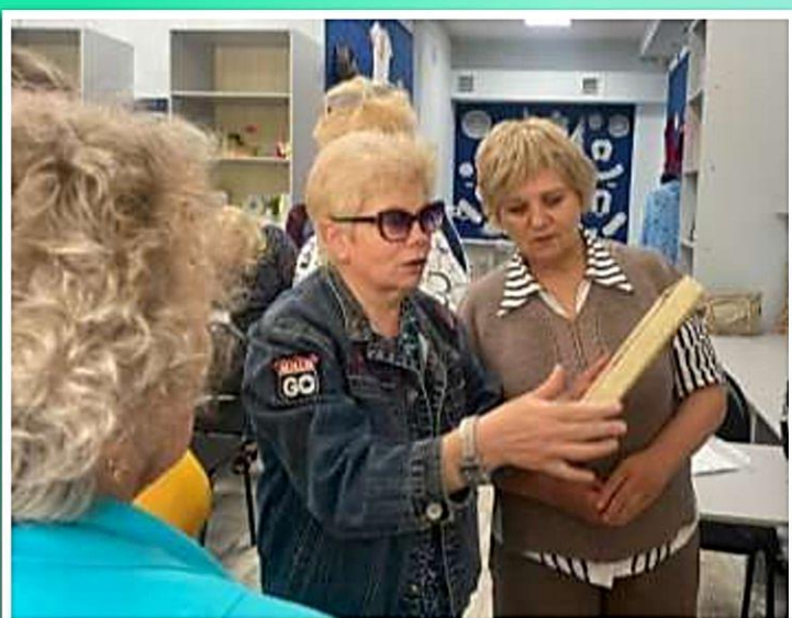
Социальный проект «ВРЕМЯ ЖИТЬ»