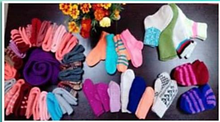
Социальные акции в поддержку СВО