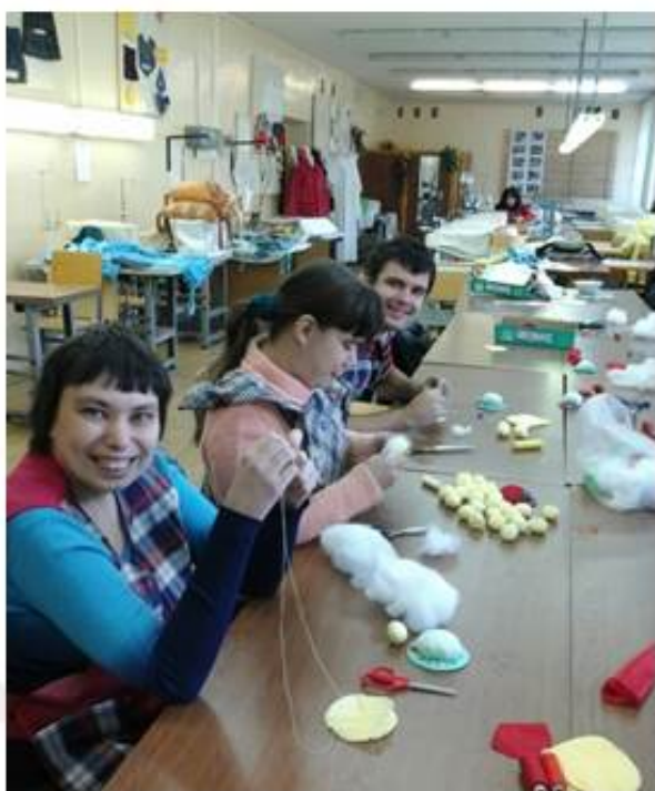
Ученики за работой

За 2015-2016 учебный год прошли обучение в ГБПОУ Владимирской области «Владимирский технологический колледж» с вручением свидетельств с присвоением квалификации «оператор швейного оборудования второго разряда» 10 человек получателей социальных услуг.