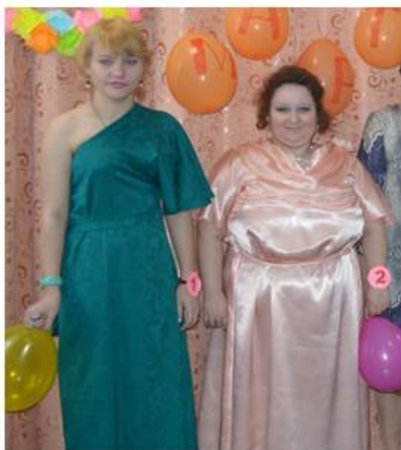
Демонстрация готовых изделий