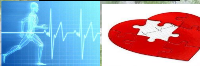
И.П. Сидя на стуле.