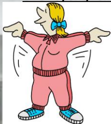
И.П. Сидя на стуле.