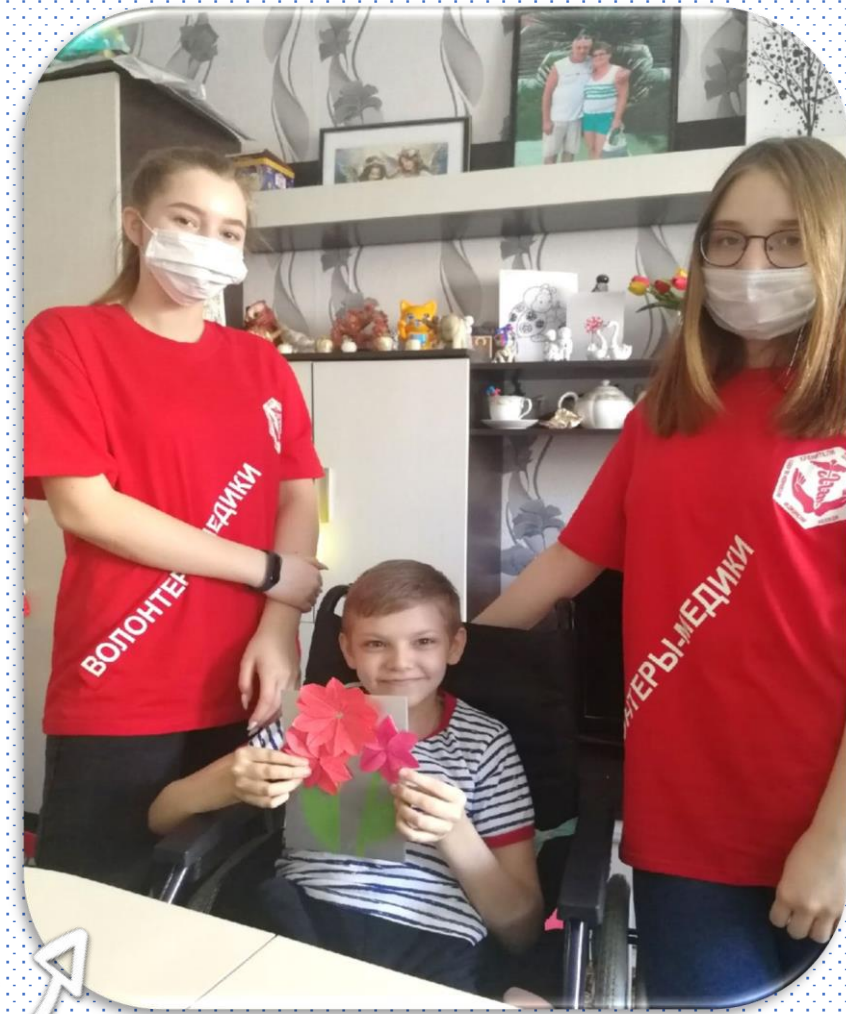
Готовим подарок бабушке