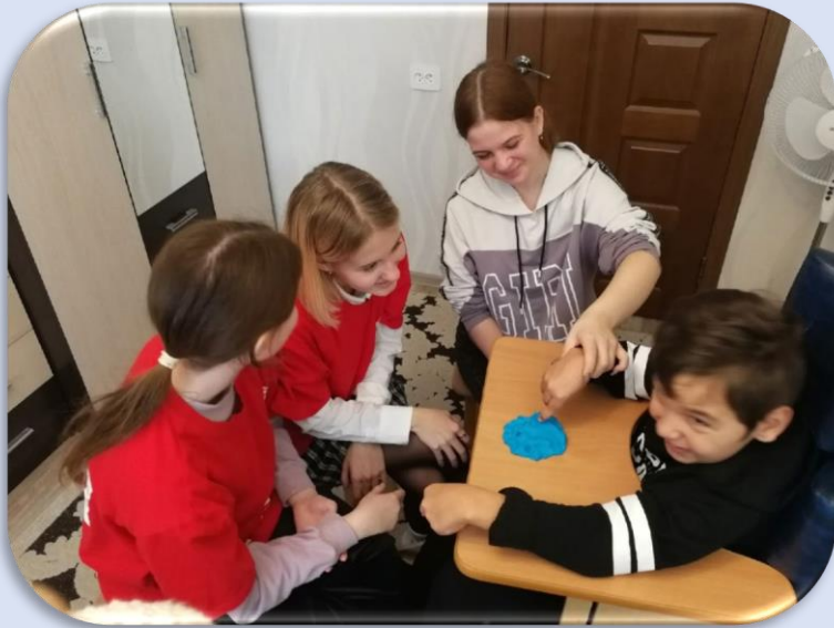
Новые встречи с друзьями