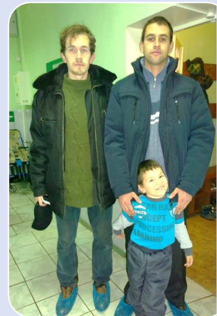
Сопровождение на мероприятия и реабилитацию