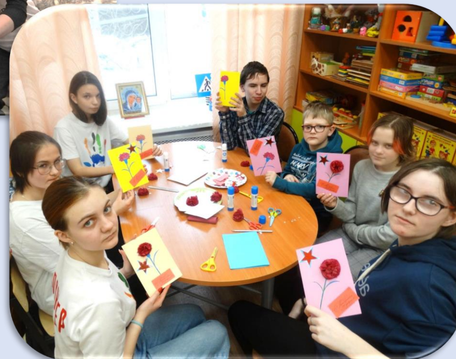
Поделки к празднику