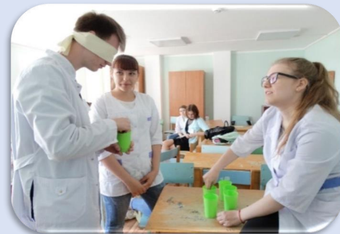
Проигрывание ситуации взаимодействия