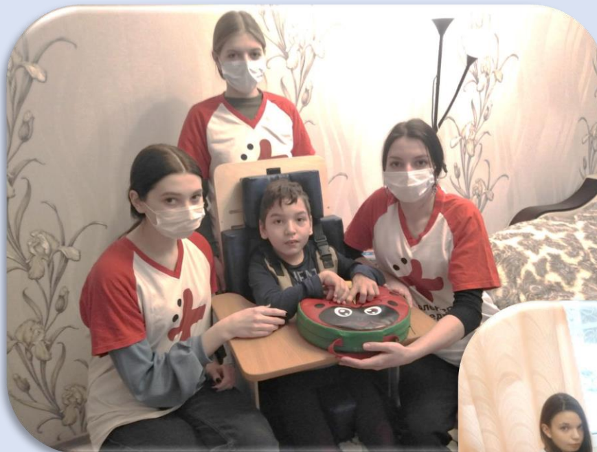
Развиваем моторику в играх