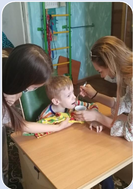
Практика «Социальная няня»