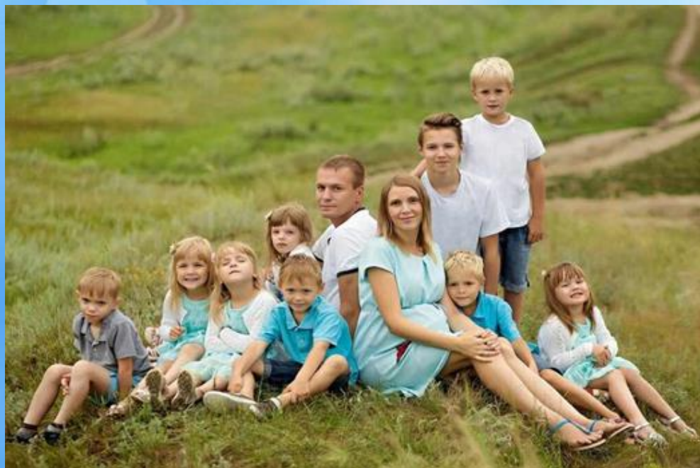
Динамика роста многодетных семей