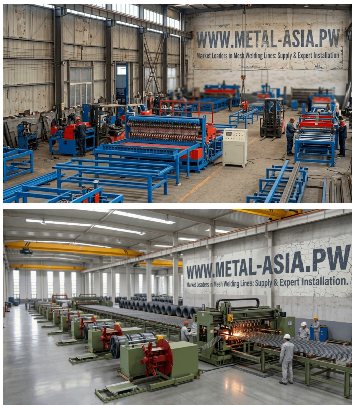
Линия производства сетки и оборудование для гибки арматурной сетки