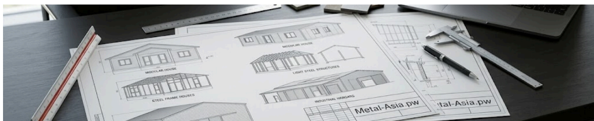
Экономичные складные дома для удаленных объектов и строительных площадок

Metal-Asia.pw предлагает оптимизированное решение для заказчиков, которым требуется функциональное жилое пространство с минимальными затратами. Двухкрылый раскладной контейнер 20 футов в эконом-комплектации сохраняет все преимущества раскладной конструкции: 37 м² полезной площади, компактную транспортировку и быстрый монтаж, но без террасы, навеса и упрощенного санузла. Данное решение идеально для временных жилых модулей на строительных площадках, удаленных производственных объектах и вахтовых поселках. Поставка осуществляется без посреднических наценок напрямую от производителя с 2009 года.