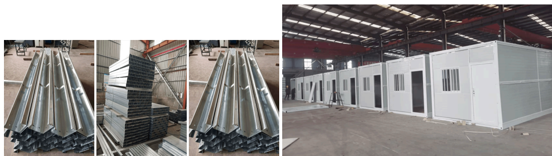
Экономичные решения для строительных площадок и вахтовых поселков