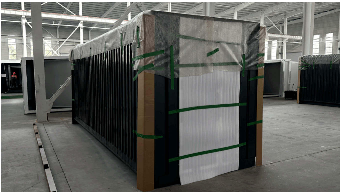
Модульные здания и гаражи для быстрого развертывания