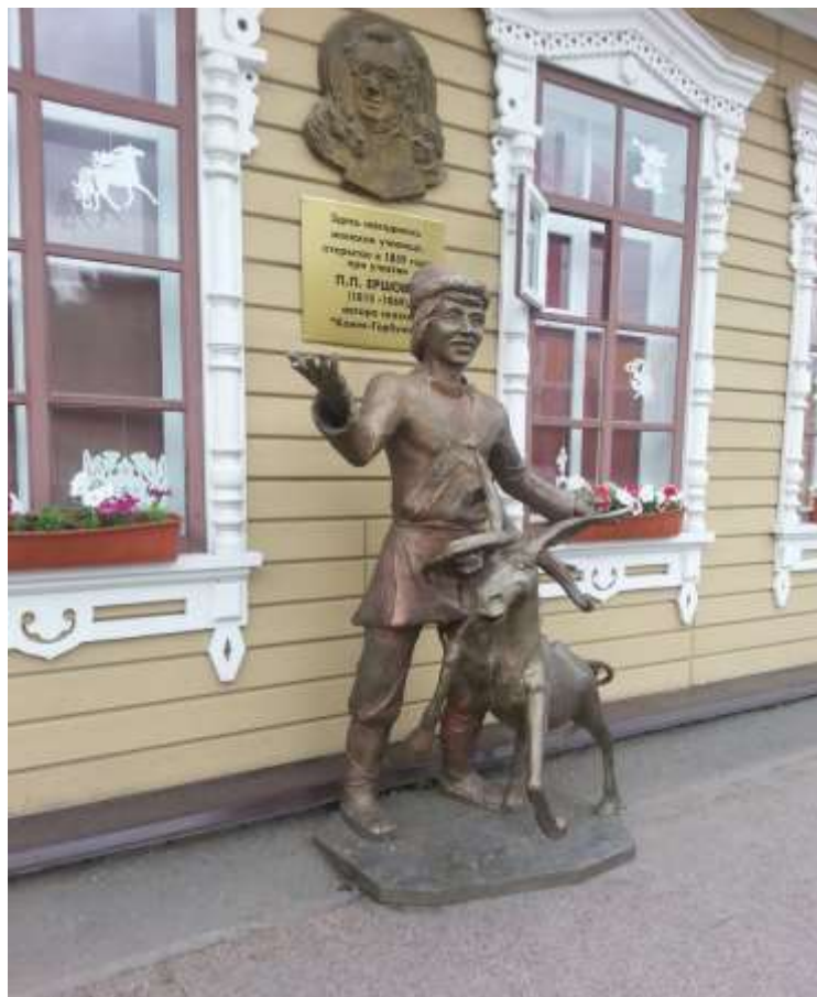
Ишим, Тюменская область. Скульптура Конек-Горбунок