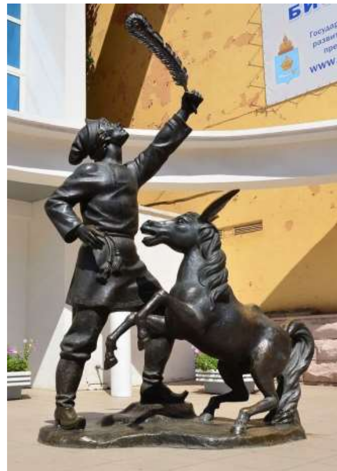
У здания Астраханского ТЮЗа скульптура Иванушки-Дурачка и Конька-Горбунка, в руках у Иванушки – перо Жар-птицы.