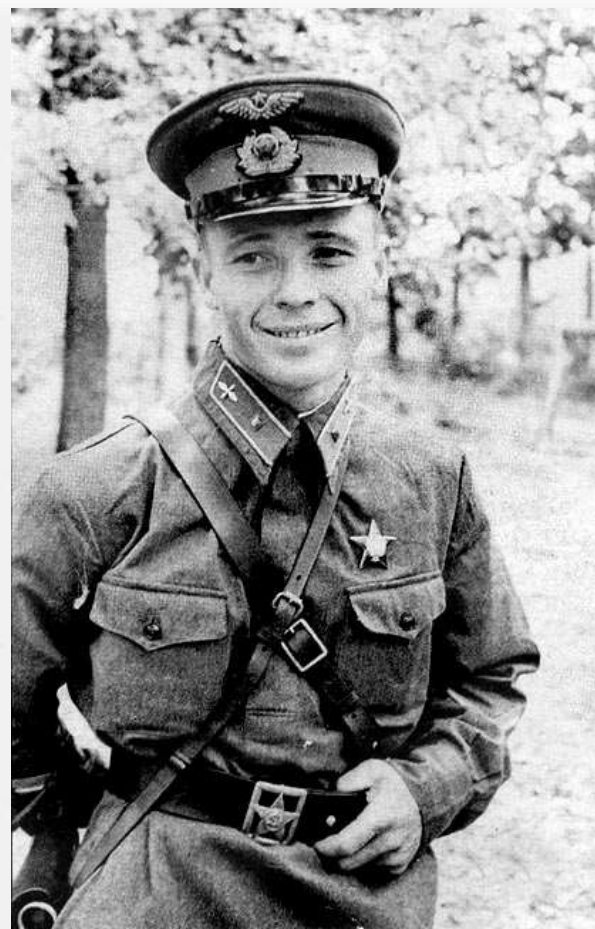
Талалихин Виктор Васильевич 18.09.1918 – 27.10.1941

В эти трагические дни мужественно держали оборону летчики-истребители. Героический подвиг совершил комсомолец Виктор Васильевич Талалихин. Талалихин. Герой Советского Союза Виктор Талалихин участвовал во многих боях, сбил 6 фашистских самолетов и погиб, защищая Москву.