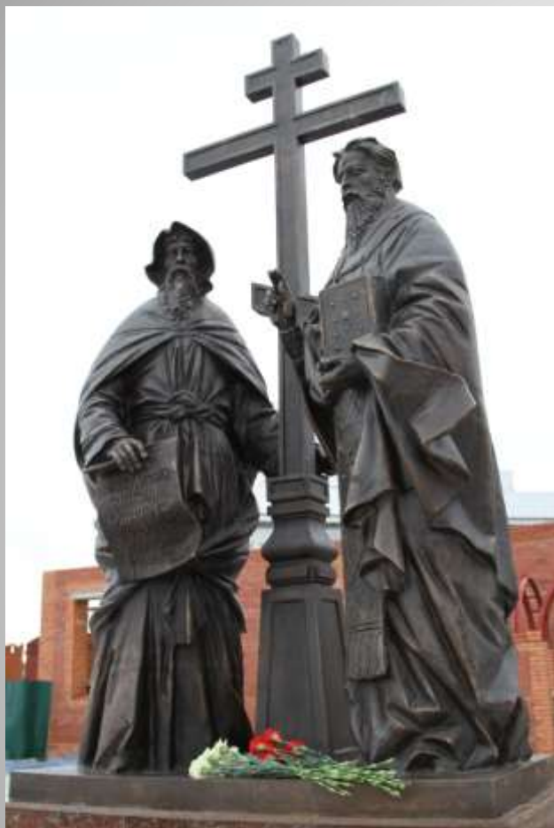
Памятник Кириллу и Мефодию в Йошкар-Оле

Открыт 2 ноября 2014 года в преддверии празднования Дня Республики Марий Эл на Царьградской площади.