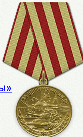
Медаль «За оборону Москвы»