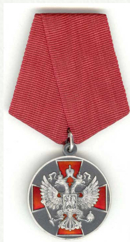
Медаль ордена «За заслуги перед Отечеством» 2 степени