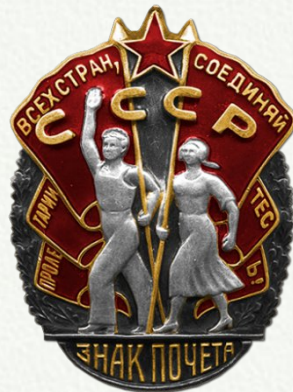
Орден «Знак Почета»